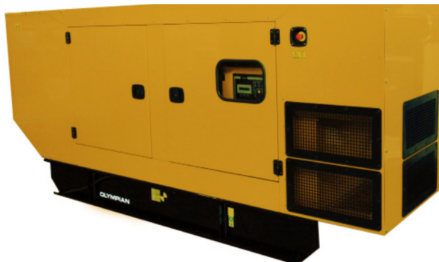
Enclosure pictured may include optional accessories